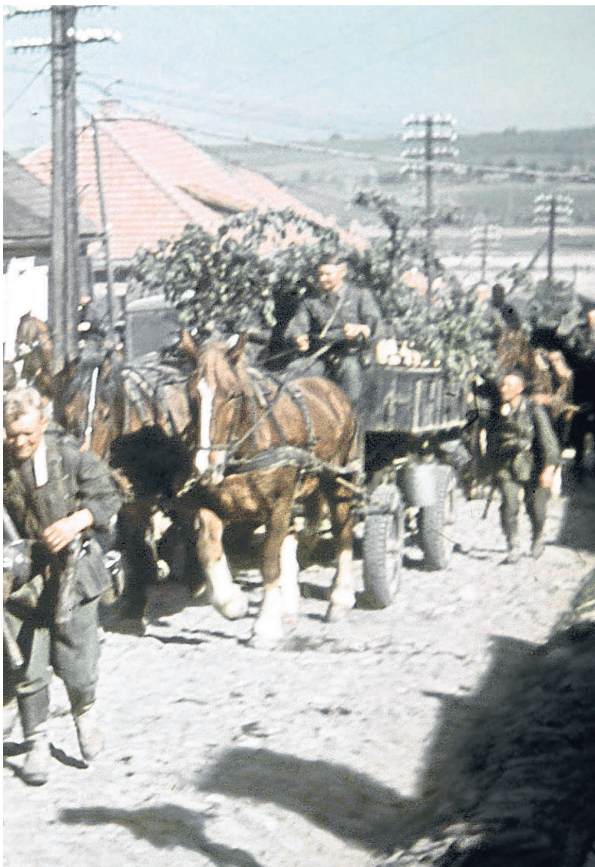
Ortschaft bergauf zu ziehen. Mit 3,6 Millionen Soldaten war die Wehrmacht am 22. Juni 1941 einmarschiert