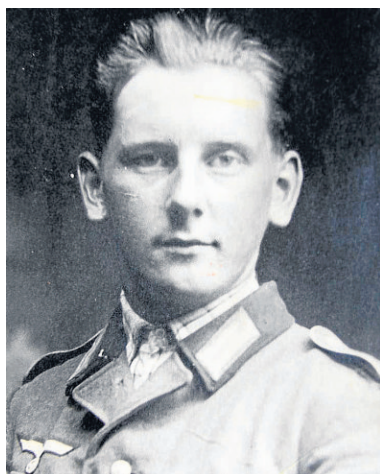
Der 19-Jährige, bevor er in den Krieg zog

auch Bergbauers Abteilung ungenügend eingekleidet: „Der Winter 1943/44 war eisig kalt, wir haben